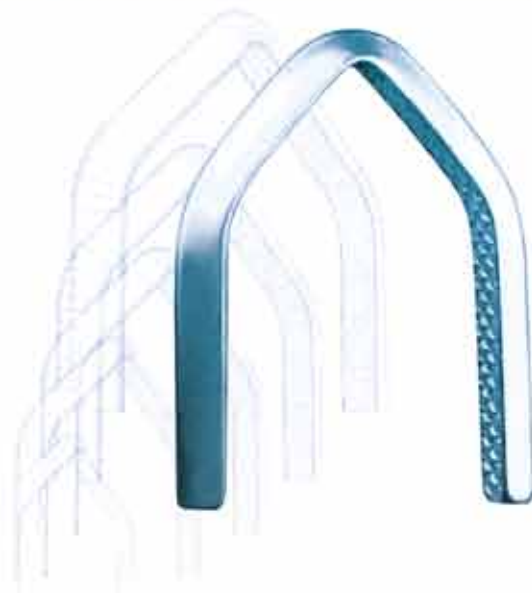
ハイパフォーマンスソフトローディングクリップ

VITALITEC INTERNATIONAL 社は 1991年の設立以来、一貫して技術開発に 取り組んできました。 新加工技術や新材料を開発し、外科用のさまざまな 画期的新製品を提供していきます。