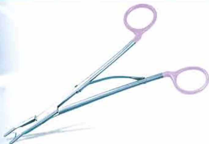
新世代のアプライヤー